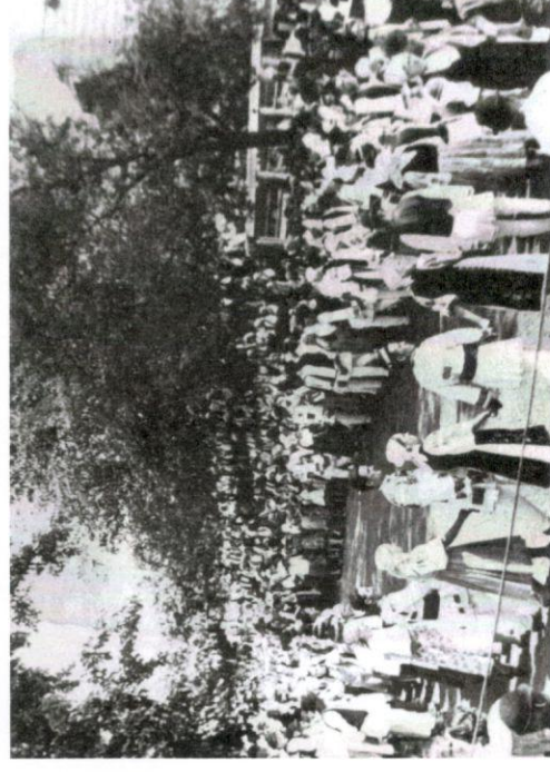
UDATUL NEVESTELOR 1972